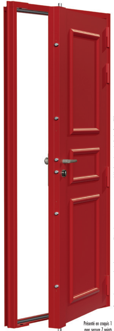
Présenté en croquis 1 avec serrure 7 points